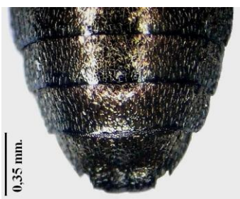
Figura 4. Último esternito, ventral

El último esternito abdominal es muy característico en esta especie, como ya indicara Levey ( op.cit. ), con el ápice ampliamente truncado y vuelto hacia arriba (Fig. 5) y una ligera depresión ovalada central (Fig. 4), en conjunto más ancha en la hembra que en el macho. Por último, el edeago es similar al de Anthaxia umbellatarum (Fabricius, 1787), aunque con un diseño algo diferente en la denticulación del pene (lóbulo mediano) (Fig. 6).