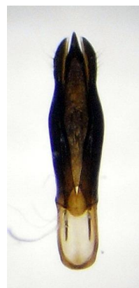
Figura 6. edeago